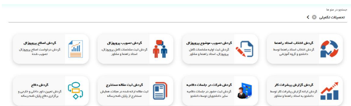
شکل ۱- بخش تحصیلات تکمیلی در پرتال دانشجویی

دانشجویان محترم باید توجه داشته باشند کلیه فرآیندهای مربوط به پایان نامه سیستمی و از طریق بخش تحصیلات تکمیلی در پرتال دانشجویی انجام می شود (شکل ۱).